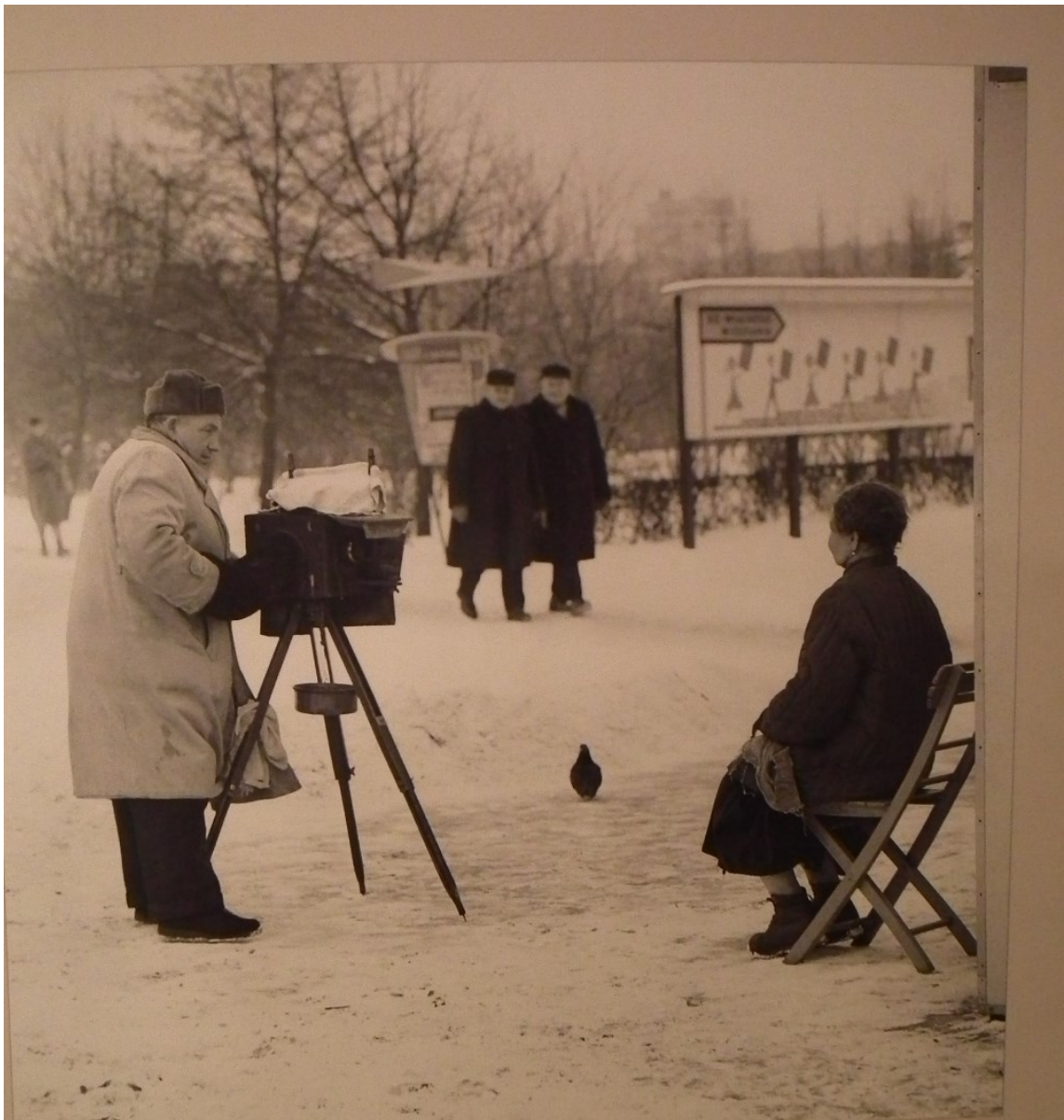
Warszawa, luty 1966. Uliczny fotograf.