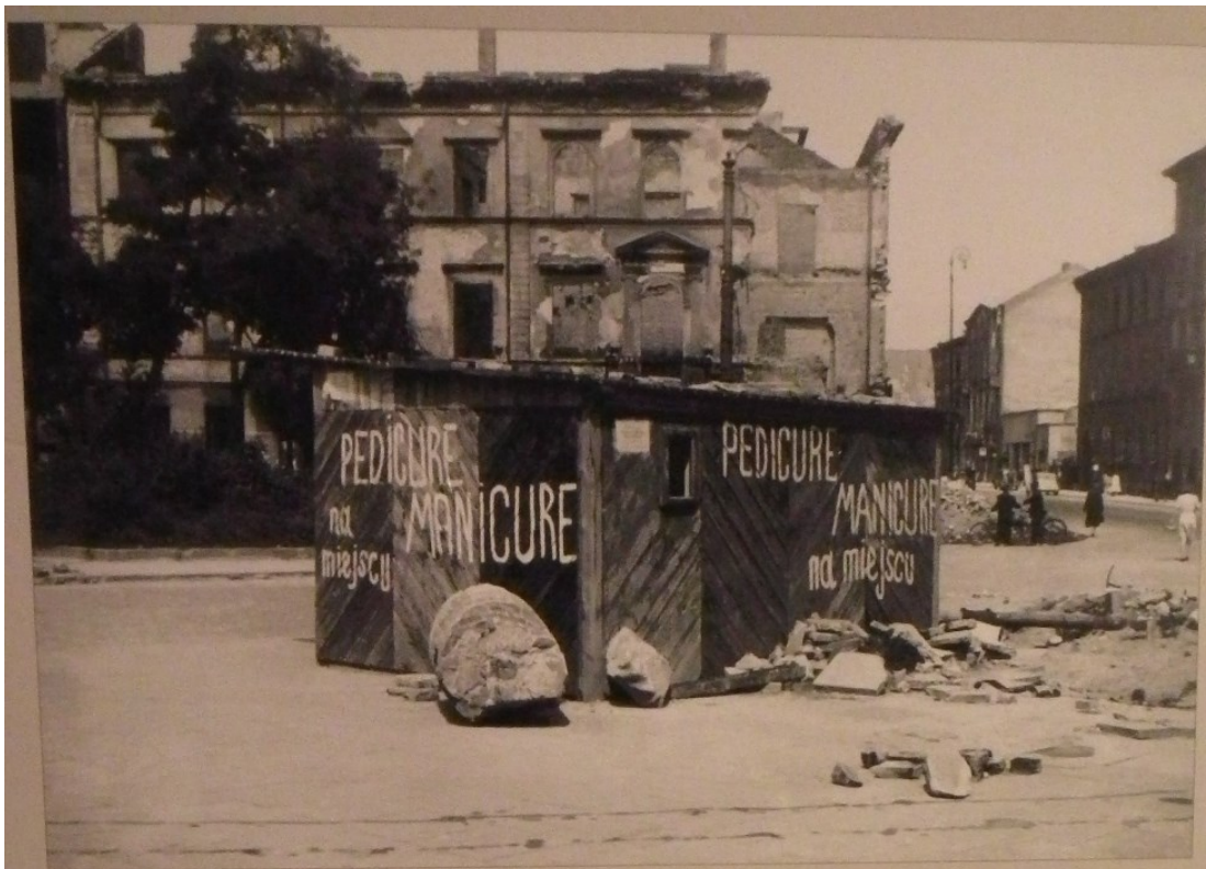
Warszawa, 1945–46.