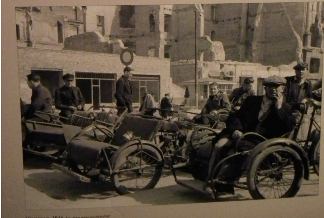
Warszawa, 1946.